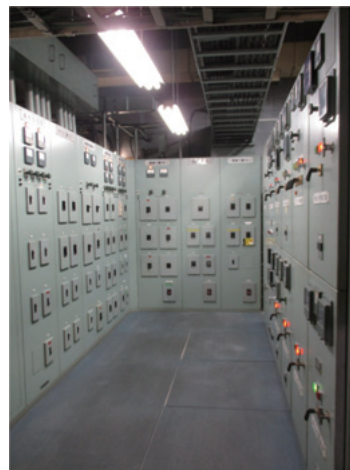
変更前 受変電設備

度も停電が発生するため、現実的な計画ではなかった。そこで電力引込は通常、1建物1引込が原則だが、2回線同時受電の許可を得るべく電力会社と協議を行った。明星ビルには電力会社借室があり、借室内に設置されている電力会社の多回路開閉器に予備回路があったことも幸いし、期限付きで2回線同時受電の許可を得た。新旧の受変電設備それぞれで受電を行い、幹線の切り換えが完了した系統から新受変電設備にて送電する計画とした。その結果、停電日はテナントごとに調整が可能となり、建物の全館停電の回避および停電時間を削減することができた。