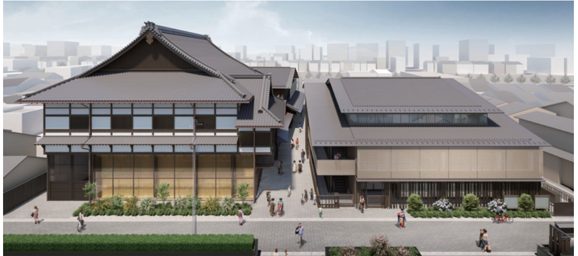
元新道小学校跡地活用計画 歌舞練場・地域施設棟