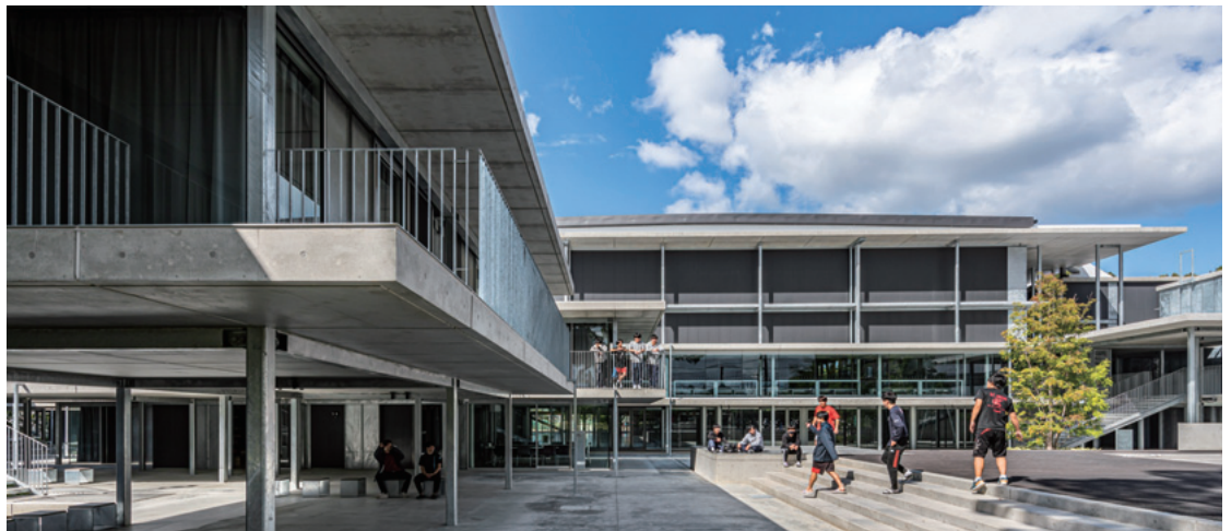
松山大学 御幸グラウンド クラブアクティビティエリア