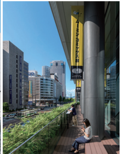
ひろぎんホールディングス本社ビル