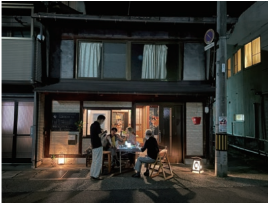
saoco lab.の軒下でのふるまい

なお、軒下に多様なふるまいが現れることを可能にしているのは、間口が狭く奥行きが長い敷地に高密度に住まうための知恵が生まれた町屋というビルディングタイプであり、軒裏をあらわしにしておけるという防火規定からの自由であり、細々とした造作を担う工務店や建具店の存在である。さらには自主的な消防活動の充実などを理由に建蔽率80パーセントとして大幅なセットバックを強いなかったための地元発意の都市計画決定である。そうした社会制度に支えられたまちなみが、絵巻からの豊かな語りのような意味解読と、軒下の振る舞いの自由を直覚させる風景となっている。その一方で、近年急速に増えているゲストハウスが物理的には形態を保ちながら、軒下には提灯を吊るしながらも、顔の見えない、いってみればオクがみえない立面となり、まちに小さなブラックホールのような異質性をもたらし、なんとなくの不安がまちにひろがっている。