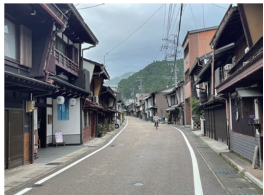
郡上八幡の日常のまちなみ