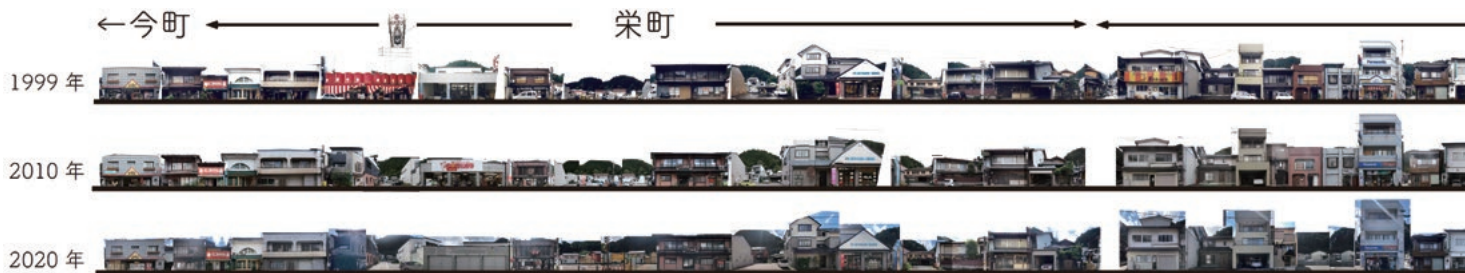
3時点まちなみ絵巻（部分）

み取れないその建物の奥にもかって、ここは行商の人たちが泊まっていたとか、土間が通りぬけられたといった情報が伝えられると、仮想的にその家に入り込み、表からは見えない様子や人々のざわめきを重ね描く。絵巻はヨコ、タテ、ナナメ、オクに読み解かれるのだ。そんな風にダイナミックに眺め、ひとしきり絵巻の上に視線を走らせたのちに、このまちに嫁いできて、その時はどんな風で、あんなこんなことがあって、私の人生ってこうだったのか、と視線を宙に泳がせながら呟く人もいる。