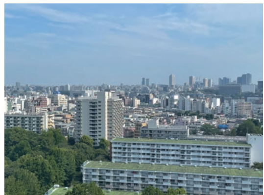
16階の研究室からの眺め

視点場としての建築のあり方もさることながら、さまざまな位置からまちを眺める機会があるのは都市にいる醍醐味であり、都市をまちとを感じる身近な体験となる。16階からは、人の活動は自ずと目にはいらない。雨が降っているかを確かめるために眼下の人が傘をさしているか否かを覗き込む程度である。よって直接的に人の姿を認めるというよりは、あのビルにもこの屋根の下にも人が暮らしているんだなあ、という人の営みの集合体としてのまちの存在を思い、夜景はその感が強調される。より高い超高層ビルからの俯瞰となればその集合体が大きくなり、営々と都市を築き営んでいる人間