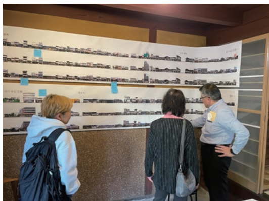
まちなみ絵巻の展示の様子