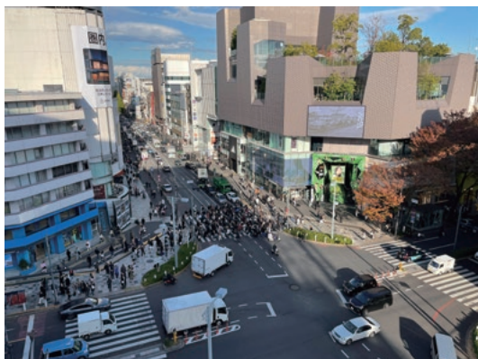
見知らぬ人たちの現れる眺め

のまちのここに人が暮らしているんだな」という感覚を与えてくれるような仕事に惹かれる。人の姿、あるいは気配の滲み出しがやはり都市のまちなみの魅力の要に思える。