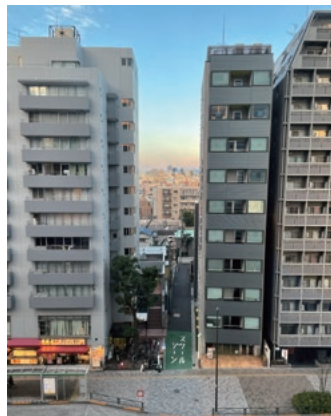
ふと目のとまるまちの眺め

2025年は建築雑誌の『新建築』の月評をなぜか担当することになり、毎号苦労したのだが、その中で2月号の集合住宅特集では、不動産経営の極みのごとく容積率を使い切りながら巧まれる空間個性の読み解きを楽しんだ。なかでもテラスやバルコニーは住み手がまちをみる視点場となり、同時にその人がまちに現れる場となることで見る見られる関係を生み出し、都市的な集住の感覚を支える。住み手は日々の暮らしのなかでふとまちを眺め、まちからは住み手の暮らしが垣間見える。そうした都市風景体験を可能とする機会として掲載作品を読み解いた。共用部となる廊下や階段が外に現れる空間構成をもつ集合住宅は減ってはいるが、そこに工夫を凝らした建築は魅力的だ。3次元に展開する中間領域の視線による接続は、都市ならではのまちなみといえよう。コーポラティブハウスのように集まって住む人々にフォーカスして共有の現れの空間をデザインする例も多々ある。ただ私としては、その敷地の前を一度かぎり通り過ぎる人に対して、「あ、こ