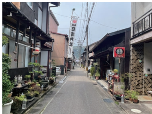
郡上八幡の軒下の様子

こうして軒下の観察、見方の解像度をあげていくと、直接そこに住まう、営む人と会ってはいないけれども、その人となりや暮らし方を感じ取ることができ、まちのリアリティが高まる。訪れる度に、あそこどうしてるかな、という思いで通りすがりに点検的眼差しを注ぎ、安堵したり、ちょっと不安になったりする。それは私以外の他者が今日もこのまちで暮らしているという感覚を支えてくれる。