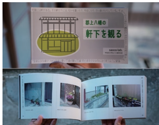
「郡上八幡の軒下を観る」（通称軒下ブック）