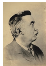
神戸時代の小泉八雲 大阪歴史博物館保管

『怪談』に代表される幻想的な作品を生み出した作家、小泉八雲。彼は、日本を「小さな妖精の国」や「神々の国」と表現し、異邦人としてその文化を見つめ続けた。