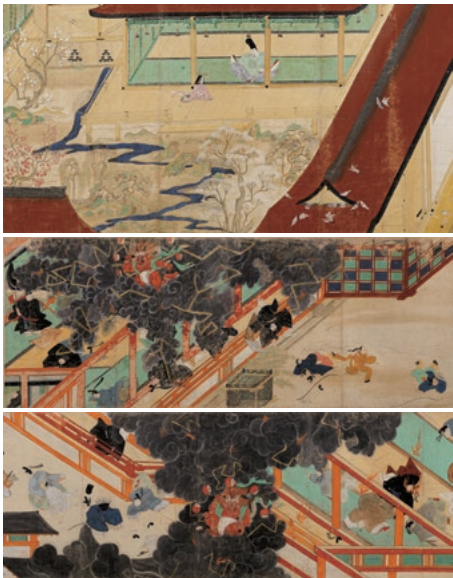
国宝 北野天神縁起絵巻（承久本）京都・北野天満宮蔵 上/巻第1（部分）この場面は前期展示・中/巻第5（部分） 同 5月26日～31日展示・下/巻第6（部分）同 後期展示