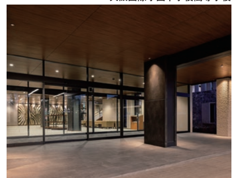
西脇カントリークラブ クラブハウス 改修