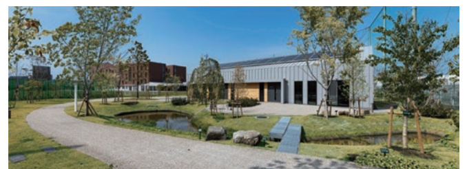
大阪国際学園中学校高等学校