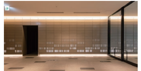
神戸旧居留地91番館