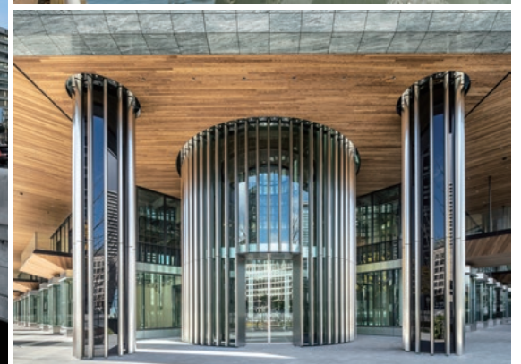
淀屋橋ゲートタワー