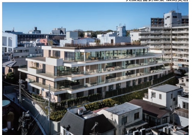
MARQ OMOTESANDO ONE