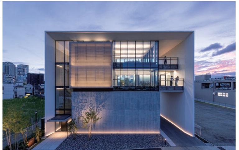
東京避雷針工業 横浜支店