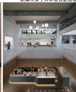
神戸学院大学有瀬キャンパス1号館