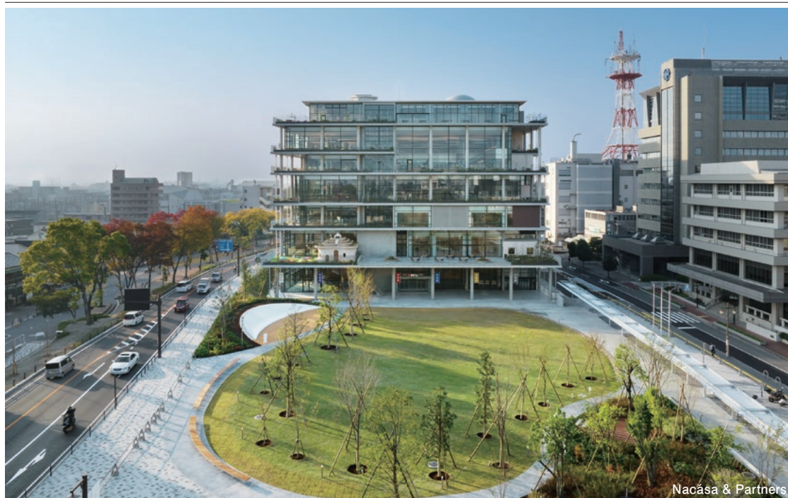
Nacasa & Partners