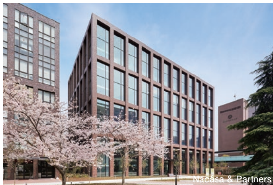
Nacasa & Partners