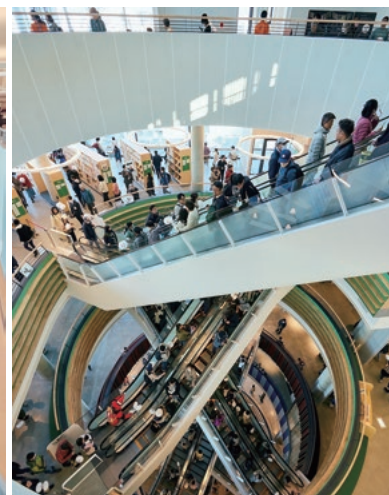
茨木市文化・子育て複合施設 おにクル