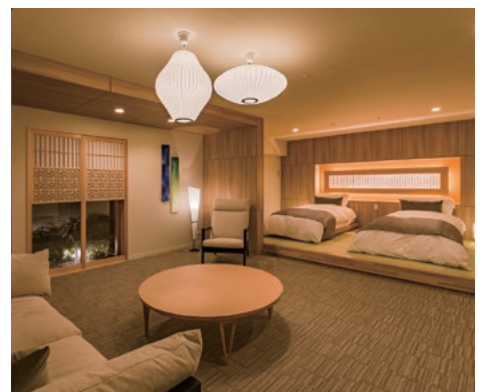
パークタワーあすと長町