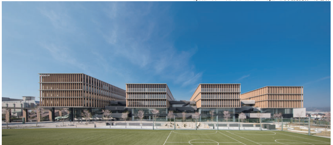
常葉大学 静岡草薙キャンパス