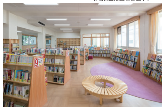
大口町立大口西小学校 (長寿命化改修)