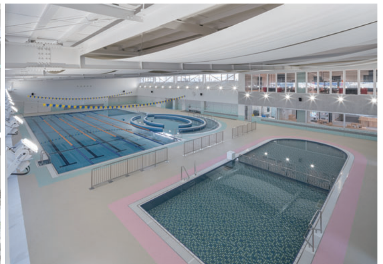
北名古屋衛生組合温水プール