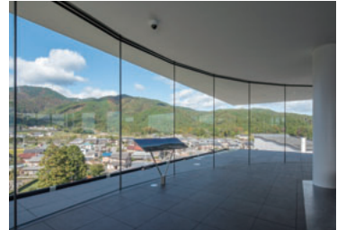
岐阜関ヶ原古戦場記念館